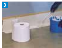
3 Danach das eingelegte Vlies mit einer Schicht Abdichtungsharz satt abdecken.